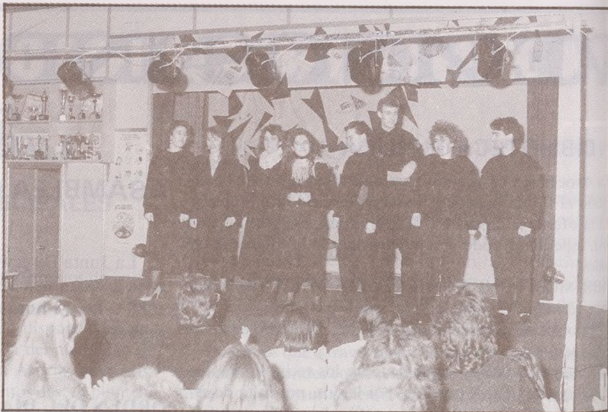
El Grupo Abathar, cuya actuación fue el plato fuerte de todas las fiestas de Navidad. Representaron teatro puro, con un éxito clamoroso.

de del día 4, nos visitó en Villa Rosa el Cartero Real, que esta vez estuvo colocado en la placita del final del autobús 73. Allí recibió las cartas y las preguntas de los niños pequeños, y repartió caramelos, sonrisas e ilusiones a raudales.