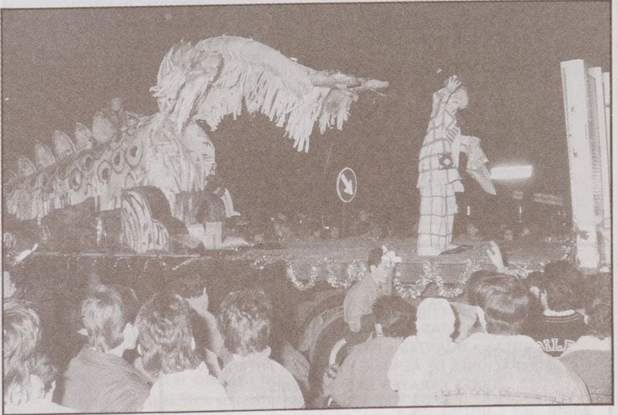
Un momento del paso de la carroza de Villa Rosa por las calles de Hortaleza. El motivo era un dragón de tres cabezas móviles, que causó el asombro de cuantos le vieron.