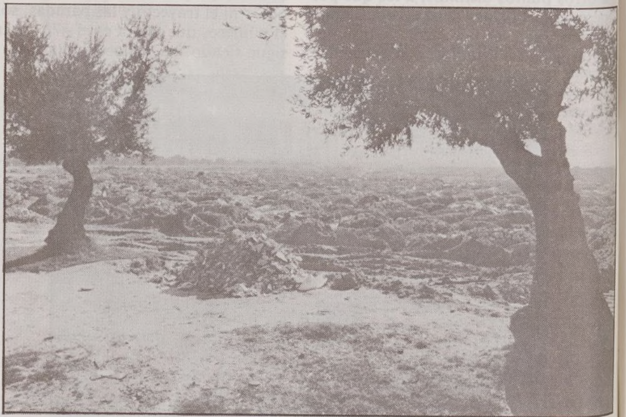
Detalle del deterioro causado por los vertidos en el Olivar de la Hinojosa.

Hace un par de meses esta Asociación denunciaba verbalmente en un Pleno de la Junta Municipal los vertidos de todo tipo de basuras que se vienen realizando desde hace mucho tiempo. Esta no es la primera vez que protestamos, de forma enérgica, ante la escasa o nula vigilancia que existe para evitar estos vertidos ilegales.