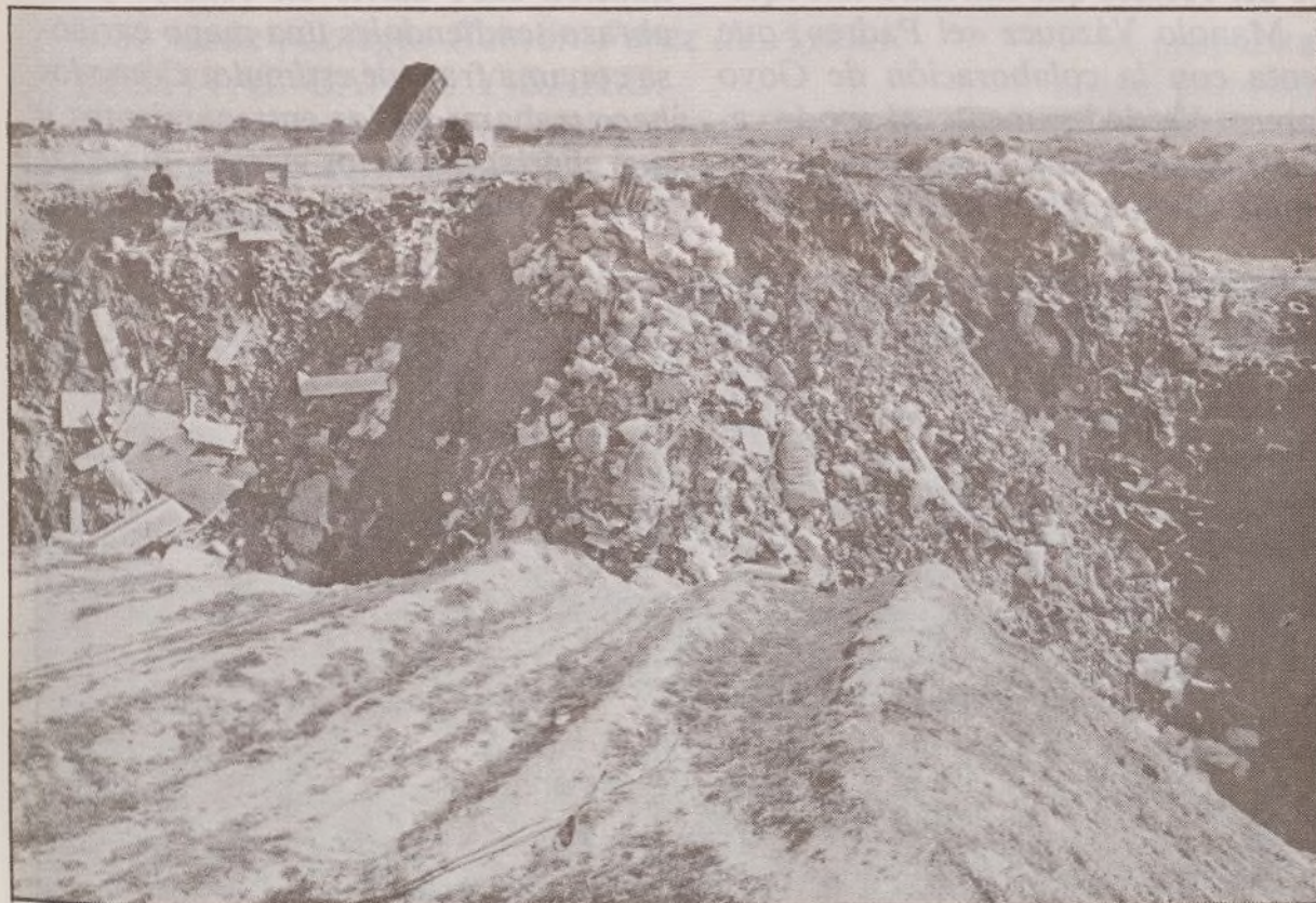
Sobre estos cimientos pretenden construir el Recinto Ferial.

Hoy, no tenemos más remedio que pasar a la acción y denunciar gráficamente algo que nunca pensamos que llegaría a producirse.