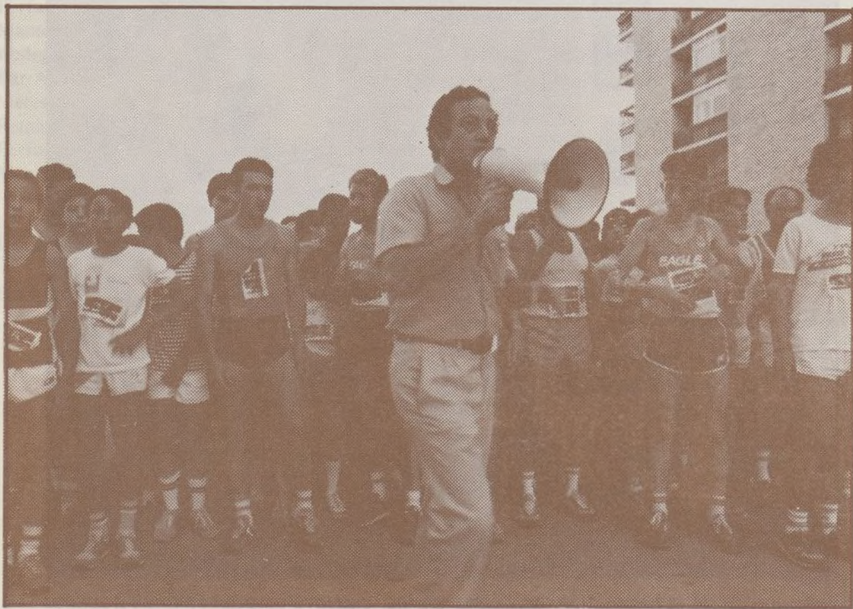
Preparados para la salida: La Carrera Popular fue la prueba reina del Deporte en las Fiestas, dada la gran participación y variedad de edades (entre 7 y 51 años).