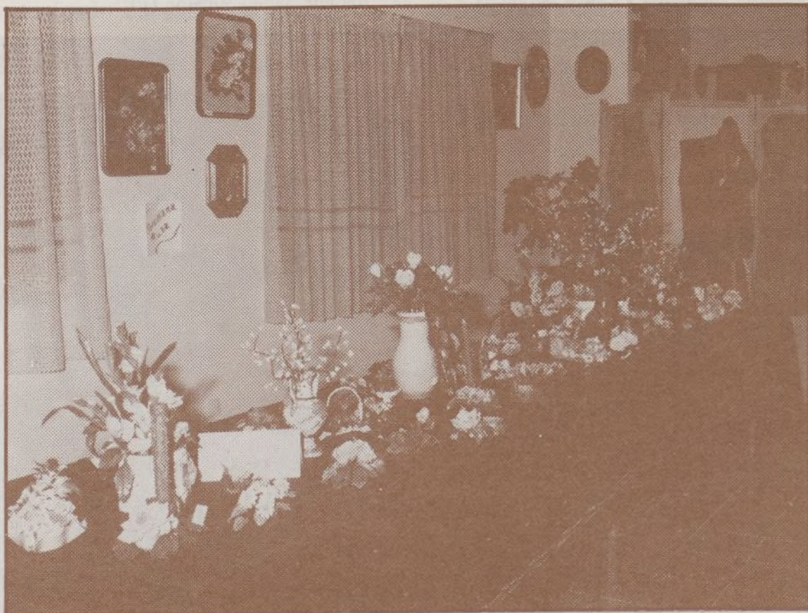
Vista parcial de la Exposición de Manualidades, que tuvo un gran éxito de público dada la variedad de trabajos realizados durante este año.