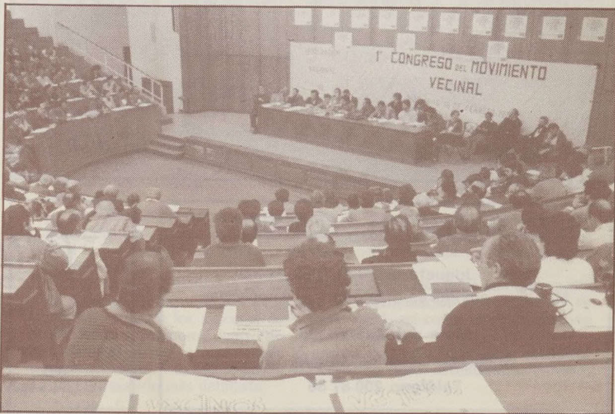
Ayuntamiento de Madrid