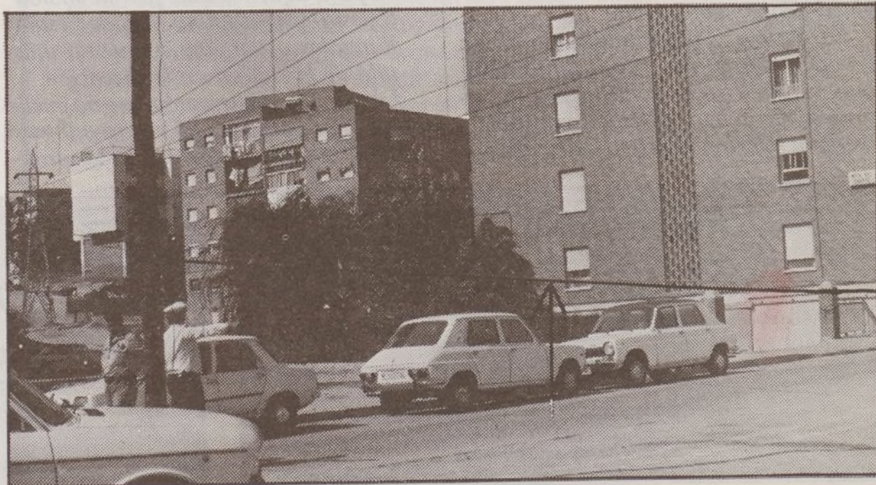
Ayuntamiento de Madrid