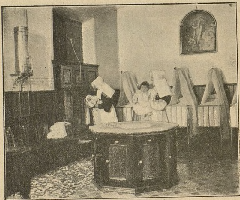
EN EL SALÓN DEL TORNO

ción donde se encuentra instalado el torno, que algunos lo juzgan como triste espectáculo y la práctica ha demostrado que es de absoluta necesidad, pues en varios países se ha querido suprimir y el número de infanticidios ha aumentado extraordinariamente. El único medio de atenuar este mal es hacerlo que tantas veces ha aconsejado el Dr. Tolosa Latour: am-