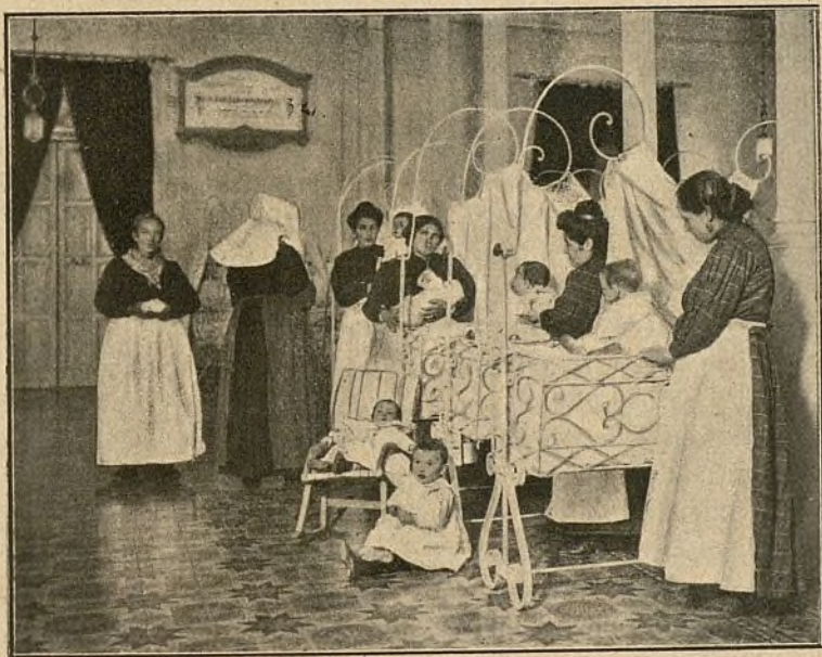
UN RINCÓN DE LA SALA DE CUNAS

Menciónanse, por último, las facultades conferidas á las Hijas de la Caridad, al Director, al Interventor, á los Profesores médicos, á los Capellanes y, en general, á todos los empleados del importante Eslablecimiento, que con tanta exactitud y escurpulosidad desempeñan los humanitarios servicios encomendados á su custodia, bajo la alta inspección de la Diputación provincial.