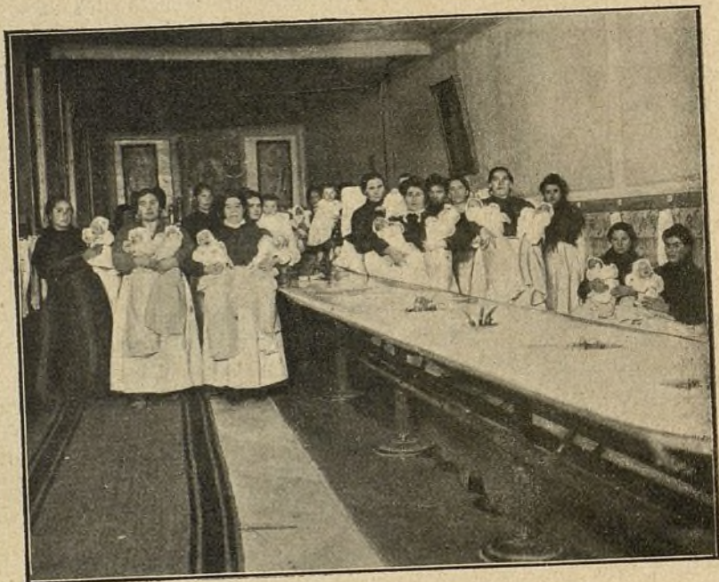
GRUPO DE NODRIZAS

Ninguna niña de las ingresadas en la Inclusa, ó recogida