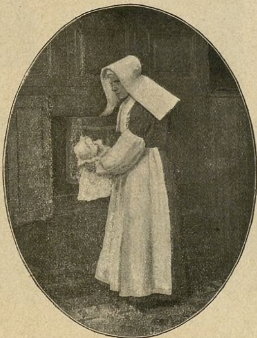
RECOGIENDO UN EXPÓSITO

Confiamos en que, tanto la Diputación provincial de Madrid como las ilustres Damas de Honor y Mérito, estudiarán el modo más conveniente para llevar á efecto el traslado de una institución encerrada en un edificio que está pidiendo ser demolido