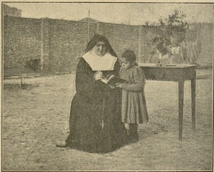
LAS PRIMERAS LECCIONES DE UNA IMPEDIDA

»La necesidad de tan importante manifestación de la cari-