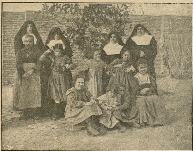
GRUPO DE ASILADAS

Haciendo comentarios sobre este hecho y acerca del género de vida y régimen que exige el estado anormal de las niñas,