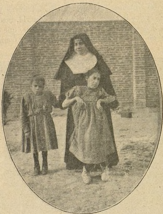
LO CARACTERÍSTICO DEL ASILO

Pero no lo hacemos cumpliendo una petición y una promesa. A pesar de que insistimos en la conveniencia de colocar sobre el pedestal de la publicidad todo lo que sea abnegación y sacrificio hecho por aliviar los infortunios de la tierra, no con-