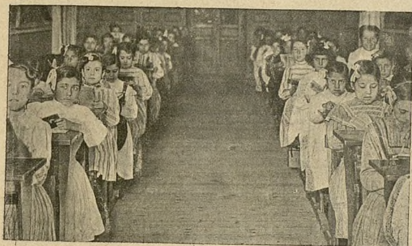
UNA CLASE DE NIÑAS

A poco de casarse S. M. el Rey Don Alfonso XIII con Doña Victoria, nuestra joven Soberana mostró deseos de conocer el Asilo; un día se presentó modestamente en la Casa del Príncipe. Con ternura y afecto maternal cogió á los pequeños, los acarició efusivamente compadeciéndose de ellos, y quizás,