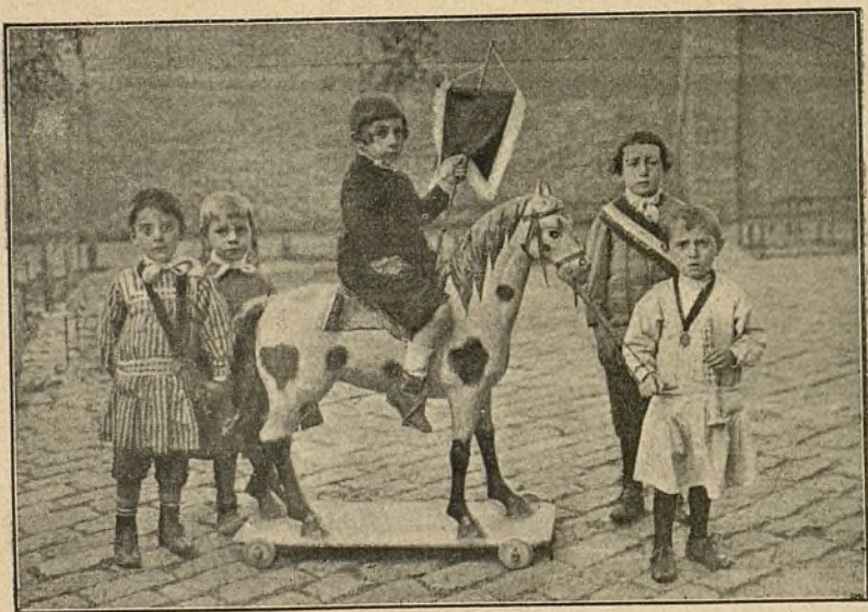
LOS MÁS ESTUDIOSOS DEL ASILO

Las Hermanas cuidan también del aseo de los niños, du-