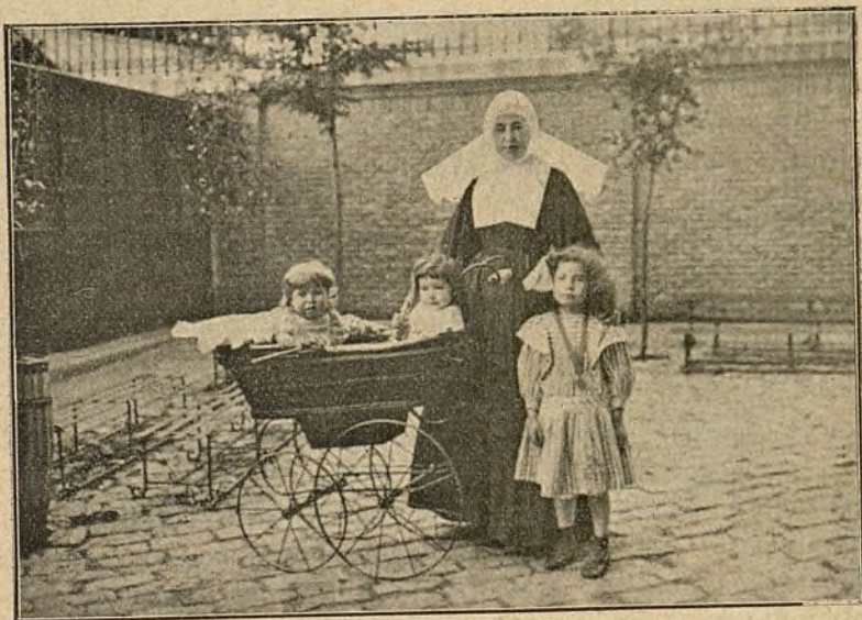
LAS DOS PEQUEÑAS DEL ASILO EN SU COCHE

peculiares y privilegiados de S. M., que ha llevado sobre sus hombros la pesada carga de una regencia llena de angustias y sinsabores, velando siempre por su patria, por el bienestar de los ciudadanos y por la salud de su hijo el Rey, al cual entregó la corona que ella le guardara; y si entre los brillantes y cincelados quedara escondida alguna espina que traspasó el corazón de la Reina Madre, ella con amor y pasión maternal la arrancaría al colocarla en las sienes infantiles de su augusto hijo. Por eso, porque fué madre, encuentran siempre en ella los niños una protectora constante que no los abandona.