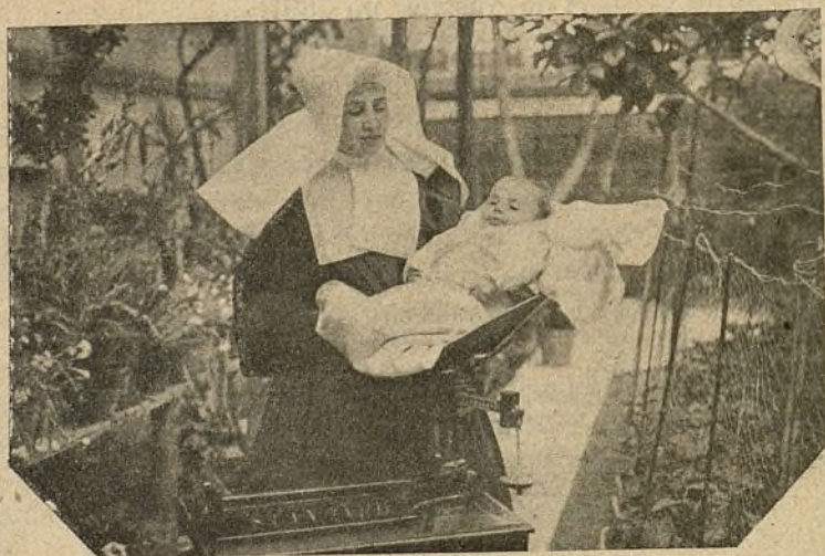
EN EL PESAREBÉS