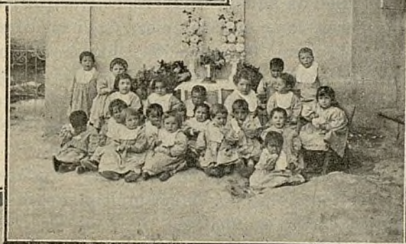
GRUPO DE PEQUEÑOS