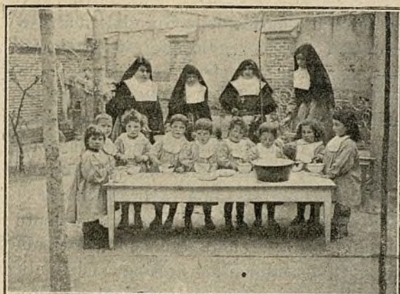
DURANTE LA MERIENDA