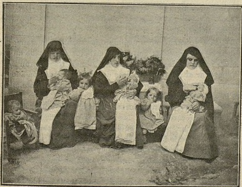
LACTANCIA ARTIFICIAL Á LOS ASILADOS

Entramos en su despacho, interrumpiendo su trabajo. Al vernos aleja libros y papeles; é instintivamente apoyada la mano derecha sobre el fichero donde se halla registrado el his-