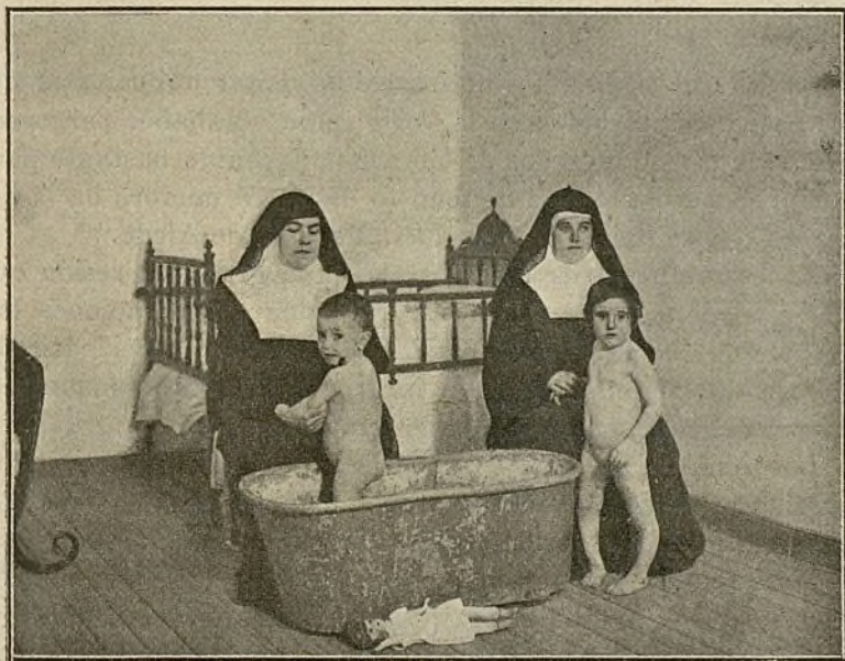
HIGIENE Y LIMPIEZA

Desde entonces prosperaron de tal suerte las fundaciones, que en muchas Parroquias pobres de los Departamentos de Francia se crearon otras con verdadero éxito. En Italia, en