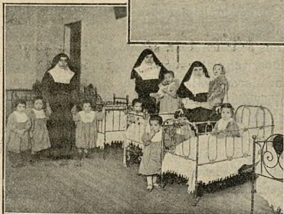
EN EL SALÓN DE CUNAS