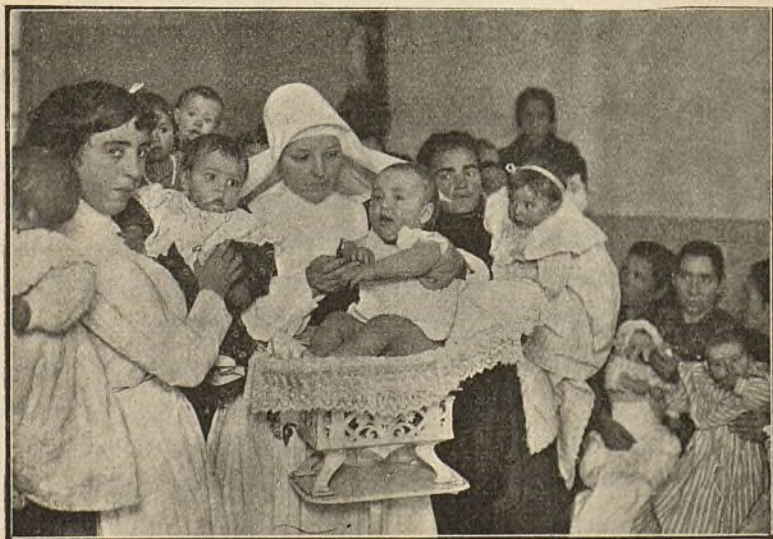
LA PESADA REGLAMENTARIA

Fiel reflejo de la fraternidad allí reinante es la labor de