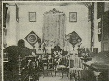
Exposición de muebles en uno de los salones.