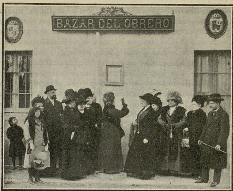
ENTRADA PRINCIPAL DEL BAZAR