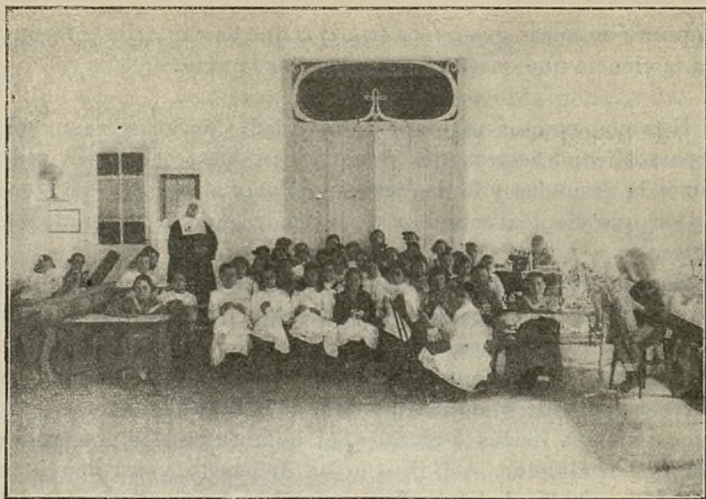
CLASE DE NIÑAS DEL GRUPO DE SAN ANTONIO