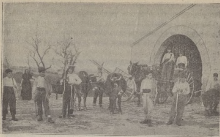
GRANJA AGRÍCOLA DE PLEGAMÀNS

En primer lugar, hay un Albergue provisional para los libertos recién salidos de la cárcel, interin no encuentran colocación. Allí se les asiste por completo, proporcionándoles manutención, vestido, etc.; pero, lo que vale más, el buen consejo para enfocar sus actividades hacia el bien.