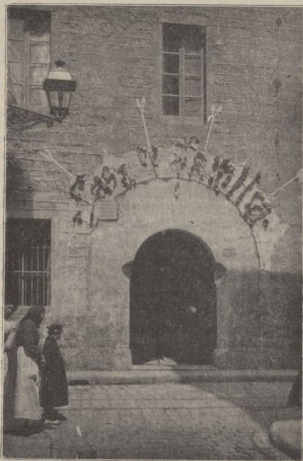
FACHADA PRINCIPAL DE LA CASA DE FAMILIA

corrupción ó explotación del menor. Ampárase también á los menores de quince años que están sometidos á la acción de los Tribunales, y, mediante circunstancias determinadas, á los menores que habiendo cumplido dicha edad se hallen en el