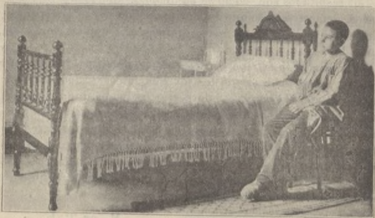
DORMITORIO DE UN JOVEN LIBERTO

A los libertos transeuntes que proceden de otras cárceles y son forasteros, que desean ir á su país, se les facilita billete