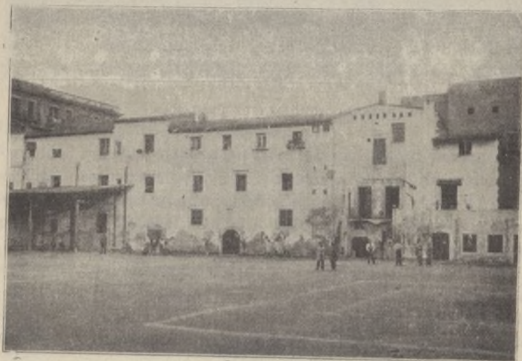
PATIO DE RECREO DE LA CASA DE FAMILIA

Desde luego, se observa un criterio racional de clasificación, mediante el cual se puede llevar á término la tarea seleccionadora indispensable en estos casos, cada uno de los cuales cons-