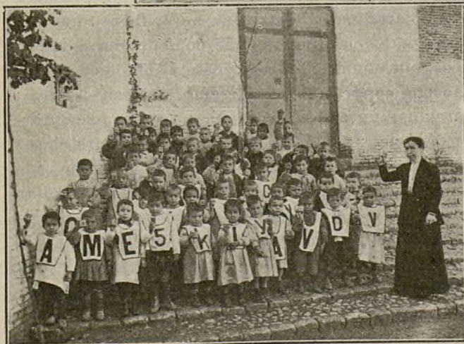
LECCIONES PRÁCTICAS DE ARITMÉTICA