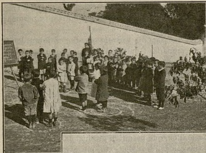
CLASES AL AIRE LIBRE