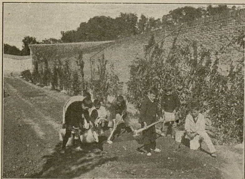
ALUMNOS HACIENDO PRÁCTICAS AGRÍCOLAS