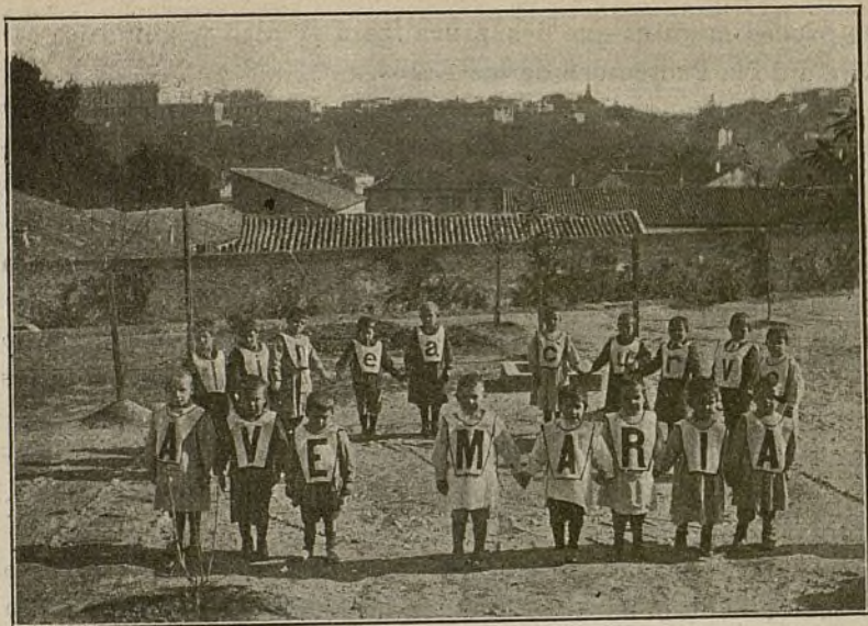
ALUMNOS DE LA ESCUELA MADRILEÑA SISTEMA «MANJÓN»