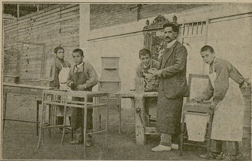
UNO DE LOS TALLERES DE LA INSTITUCIÓN

Si nos fijamos en el comienzo de las obras sociales, fundadas para la educación de los niños abandonados, encontraremos en ellas los mismos orígenes: las diez jitanillas a las que enseñaba