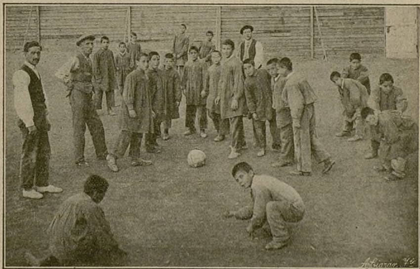
PATIO DE RECREO DE LA INSTITUCIÓN

años estas infantiles inteligencias, estos cuerpos tan pequeños, encierran tantos vicios y ruindades; da miedo el pensar lo que estas aviesas inteligencias pueden hacer el día de mañana al oírles sus raterías, sus viciosas vidas, sus conversaciones, sus relatos del pasado, que, aunque corto, no por eso deja de estar lleno de maldades; aterra la estela que estos desdichados dejarían detrás de sí en el navegar de la vida. Su falta dominante es la mentira y el engaño, su vicio el tabaco y su delito el hurto de todo lo que está al alcance de su mano; los primeros días les cuesta mucho habi-