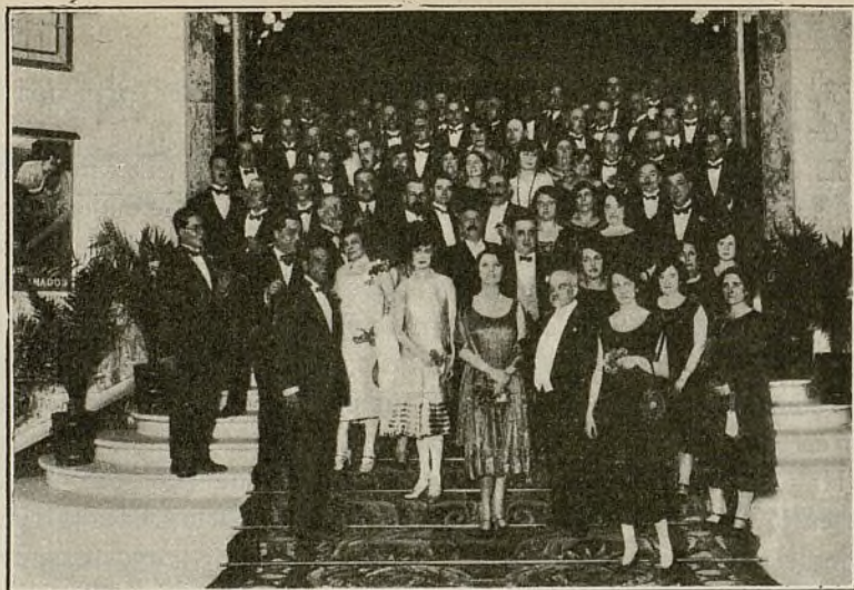
Grupo de congresistas