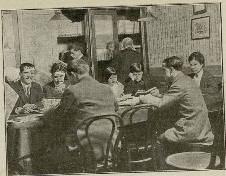
EN LA BIBLIOTECA DE LA ASOCIACIÓN DE SORDOMUDOS DE MADRID