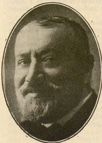
Excmo. Sr. D. José Francos Rodríguez, que siendo Ministro de Gracia y Justicia asistió a Barcelona y Zaragoza en representación de S. M. el Rey y del Gobierno, pronunciando elocuentes discursos que reflejaron la emoción sentida al ver el funcionamiento de los Tribunales para niños.