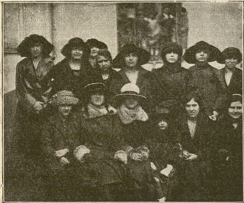
GRUPO DE DONANTES Y ALUMNAS QUE OONTRIBUYEN AL SOSTENIMIENTO DE LA CANTINA.