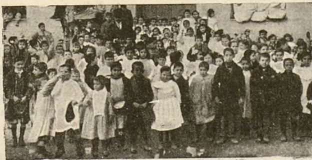
SALIENDO DEL COMEDOR DE LA CANTINA NORMALISTA.

He aquí un dato original: no hay más servidoras al servicio de la Cantina que una cocinera. Las alumnas son las que atienden y sirven a los niños. Todas toman parte en esta función,