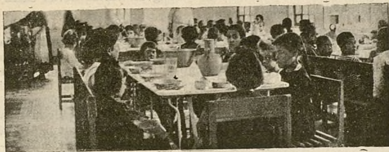
GRUPO DE NIÑOS EN LA CANTINA.