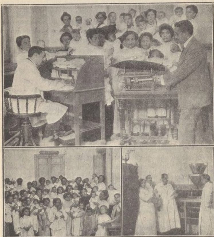
Niños alimentados en la Gota de Leche Municipal.