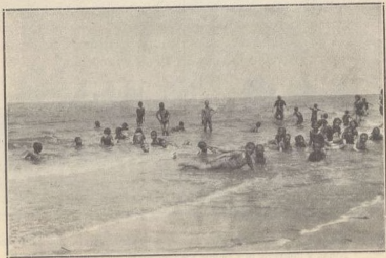
COLONOS Y ASILADOS BAÑÁNDOSE EN EL MAR