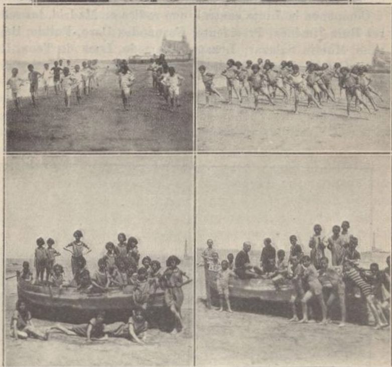
En el comedor de uno de los pabellones. — Practicando la gimnasia sueca. Niñas y niños de la Colonia escolar en la playa de Chipiona.