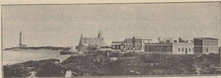
VISTA GENERAL DEL SANATORIO MARÍTIMO