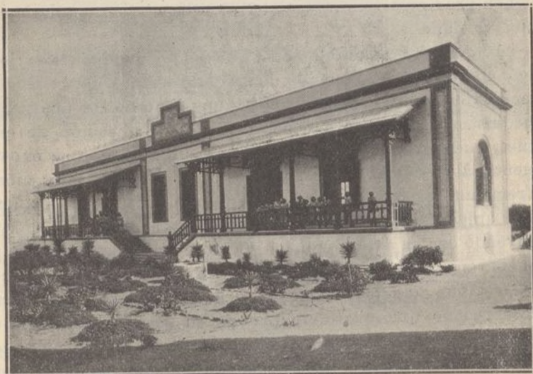
UNO DE LOS PABELLONES

¿Cómo puede ser esto? ¿Cómo es posible omitir su nombre, que está enaltecido en toda España, y es igualmente honrado en el extranjero, pues su influencia benéfica se ha extendi-