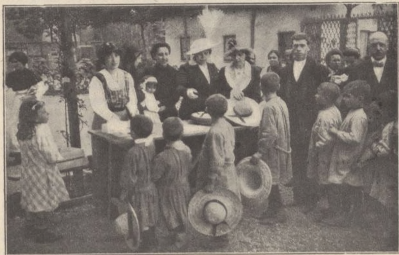
REPARTO DE SOMBREROS Y PAÑUELOS A LOS NIÑOS

Antes de terminar la fiesta el Secretario de la Junta, don