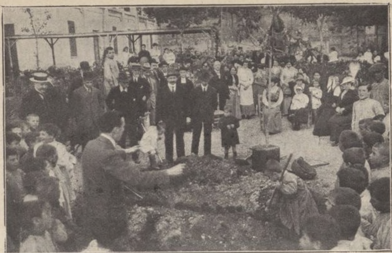
PARQUE INFANTIL DE HOSTAFRANCHS: LA PLANTACIÓN DEL ÁRBOL FRUTAL