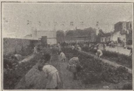
HUERTOS DEL PARQUE INFANTIL

Los «Parques Infantiles» son, pues, una estancia para que los niños, durante la edad escolar, esto es, desde los seis años hasta los trece, no vayan errabundos por las calles mientras sus padres estén en el trabajo. En el «Parque Infantil» se reciben los niños desde media tarde antes de entrar los mayores al trabajo, y son recogidos por éstos de siete á ocho de la noche, después de salir del mismo. La Junta cuida de acompañarlos a la escuela y los recoge a la salida, sirviéndoles comida a medio día y merienda por la tarde. Durante las horas extraescolares, los niños son debidamente vigilados y ocupados en juegos de ejercicio al aire libre, en talleres y huertos y jardines y en el repaso de sus lecciones. Además, la Junta tiene así