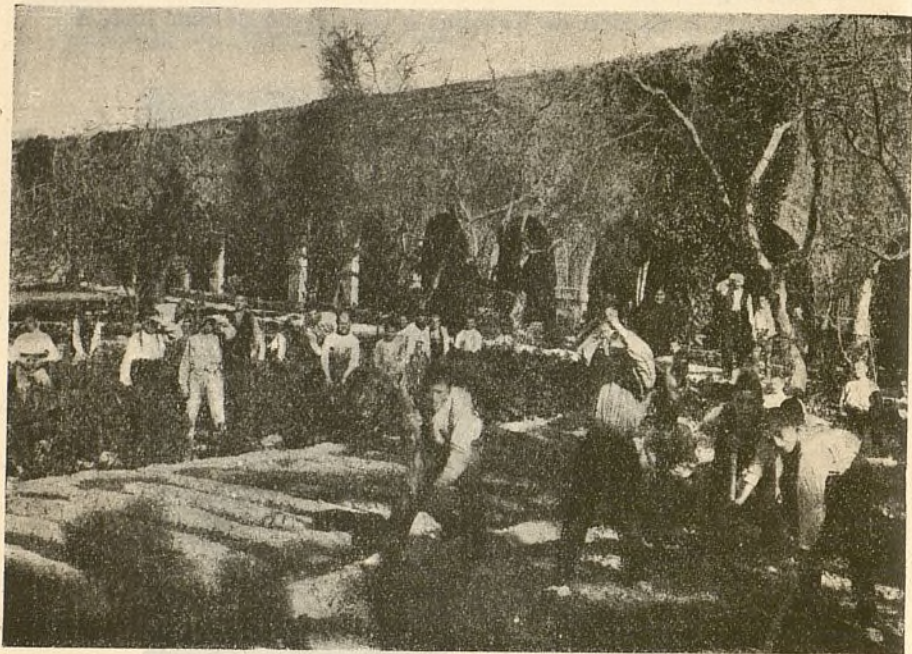
UN ASPECTO DE LA INSTITUCIÓN TUTELAR

Hallándose el año 1910 ejerciendo su cargo en el Penal de Tarragona, persuadióse de que el 80 por 100 de los reclusos provenían de la temprana edad de doce a dieciséis años, y ante este hecho tristísimo pensó en la creación de una Casa Asilo para dar cabida a todos los niños que faltos de una persona que los guíe y proteja, recurren a la vida bohemia y vagabunda, errando por las calles, sucios, harapientos, con cara macilenta en la que se