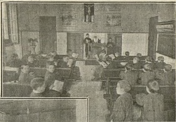
CLASE DE INSTRUCCIÓN PRIMARIA