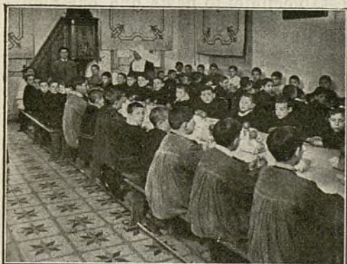
LOS ALBERGADOS EN EL REFECTORIO