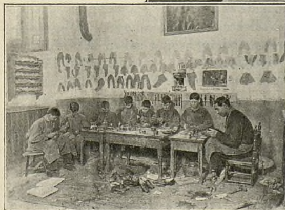
TRABAJANDO EN LA ZAPATERÍA