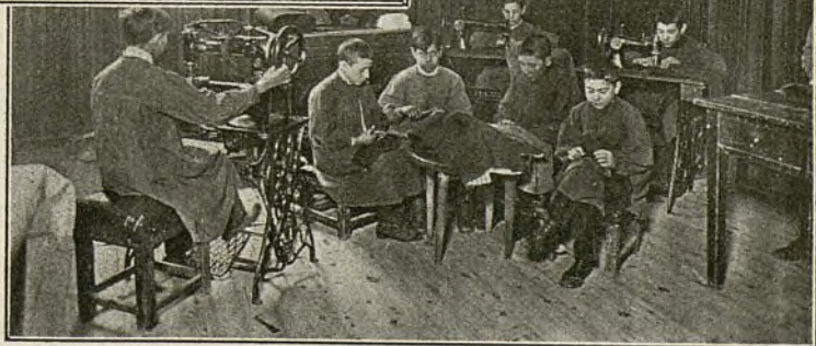
TRABAJANDO EN LA SASTRERÍA

se labora además con exactitud y actividad, pues como los encargos aumentan de día en día ha habido necesidad de reforzar el número de obreros asilados, a fin de que en cualquier momento tengan los clientes la seguridad de ser atendidos. A la vez se han adquirido nuevos elementos de material con lo cual realizan toda clase de obras por importantes que sean.