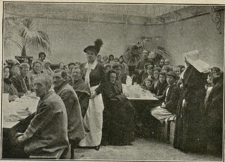
LA MARQUESA DE SQUILACHE ENTRE LOS POBRES DEL COMEDOR DE CARIDAD