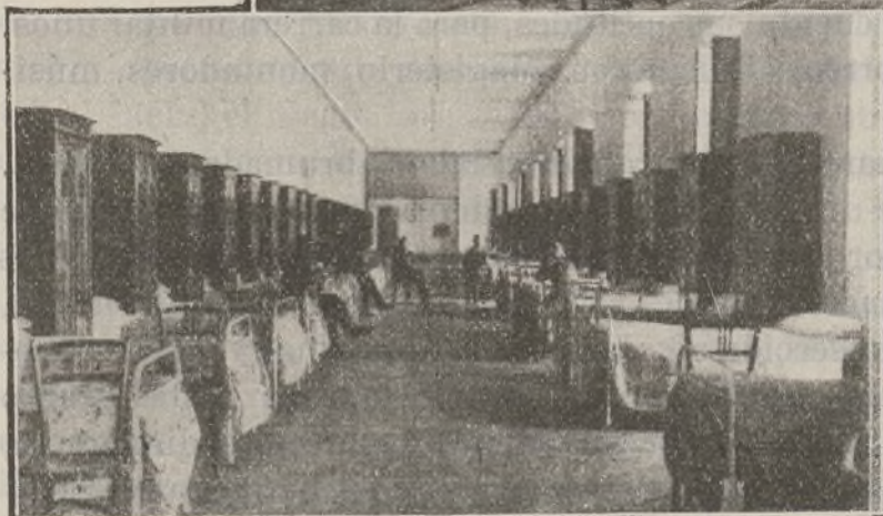
Dormitorio de la Segunda unidad.