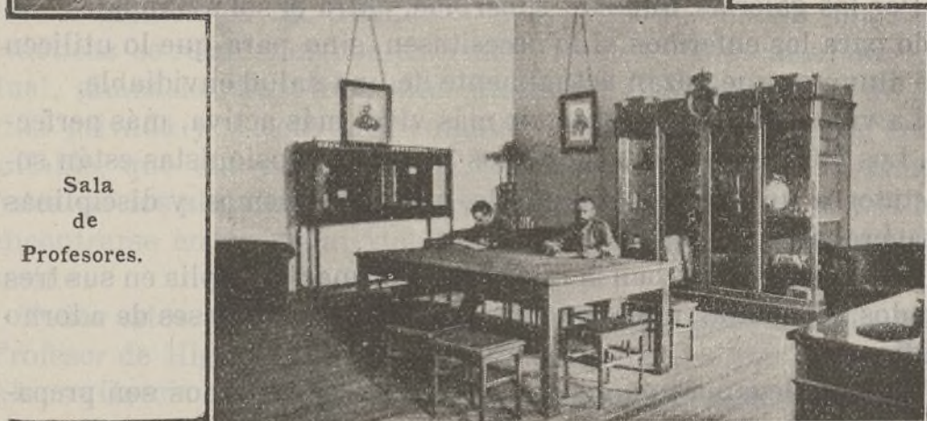
Sala de Profesores.