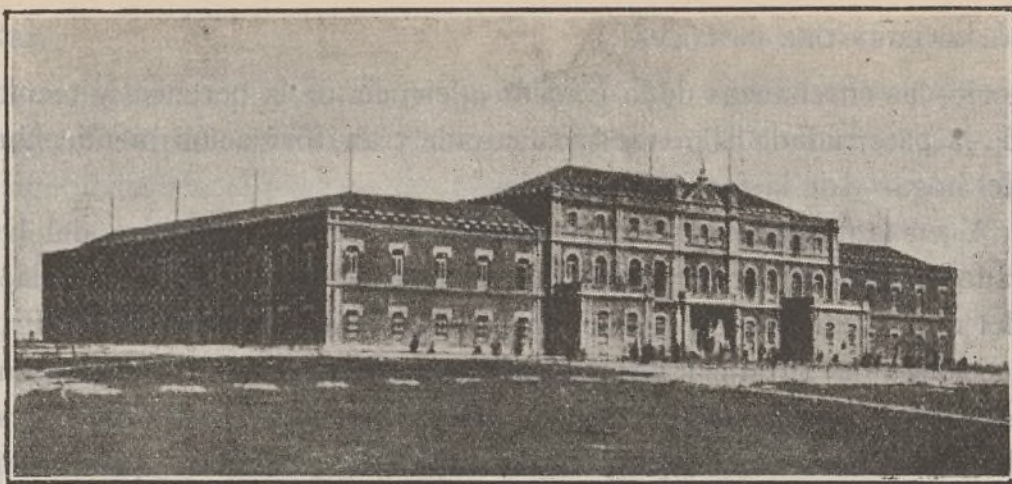
VISTA EXTERIOR DEL EDIFICIO