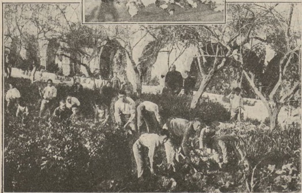
LA CASA ASILO DE SAN JOSÉ DE TARAGONA.