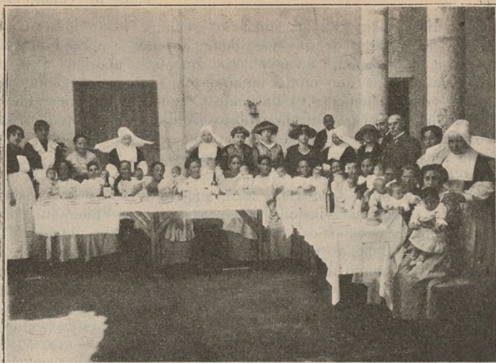
COMEDOR DE EMBARAZADAS Y DE MADRES LACTANTES EN VALLADOLID