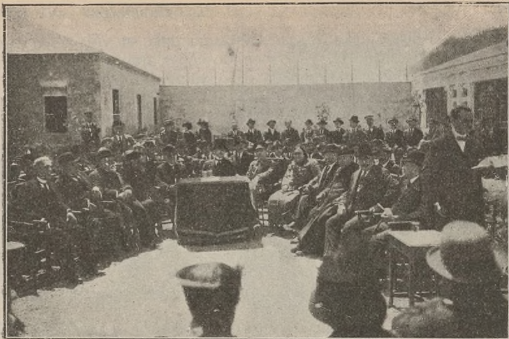
LA CASA ASILO Y ESCUELA DE REFORMA DE TARRAGONA