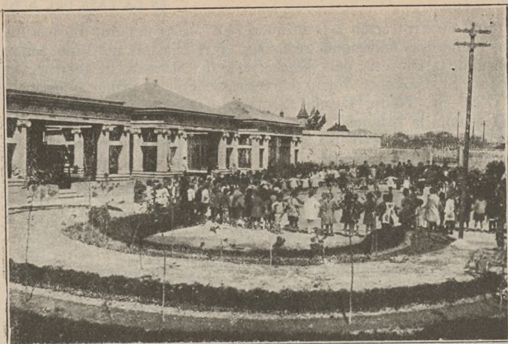
LA ESCUELA JARDÍN, INAUGURADA RECIENTEMENTE EN CARTAGENA