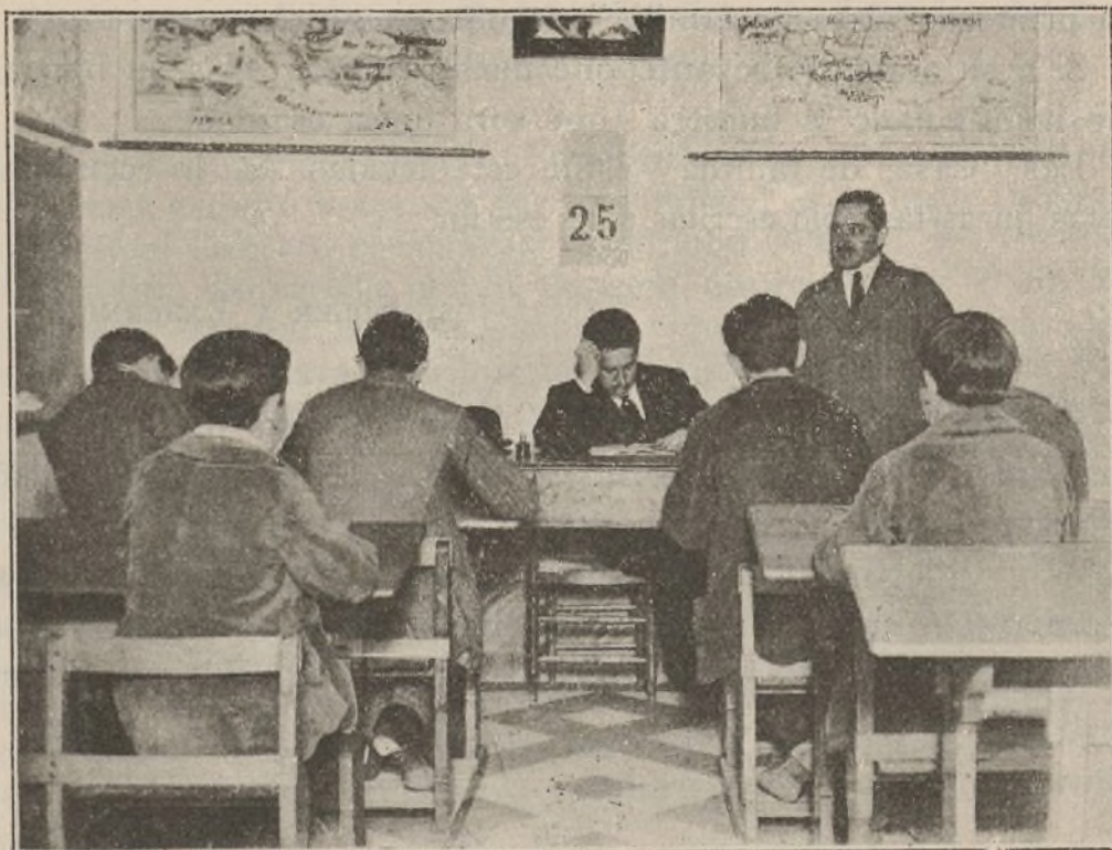
Una de las clases de estudio de las Casas de familia

¿Responde la práctica al ideal? La institución fundadora así lo declara enorgullecida. Veamos los siguientes ejemplos: