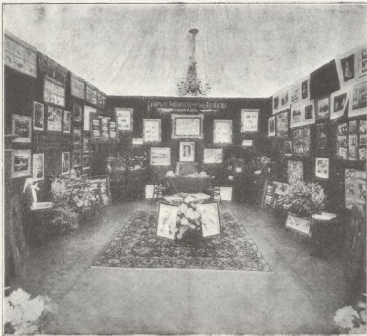
Los Tribunales Tutelares para Niños, Juntas provinciales de Protección a la infancia, Escuelas de Puericultura, Dirección de Sanidad, Lucha Antituberculosa, Cruz Roja y Escuelas Maternales, muestran su amplio radio de acción en la obra protectora.

Fué en la memorable sesión plenaria que en el mes de marzo tuvo el Consejo Superior de Protección a la Infancia, presidido por el Excmo. Sr. Ministro de la Gobernación, que yo tuve el honor de proponer a la docta Asamblea la necesidad urgente de crear, por dignidad patriótica, un Comité Nacional Español, como