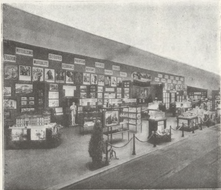
Magnífica instalación de la Caja de Pensiones para la Vejez y de Ahorros de Barcelona, que ha sido muy celebrada por cuantos han visitado la Exposición.

Como corona, en el centro del stand, campeaba el nombre sagrado de España, la obra pintada por Martínez Baldrich, a quien