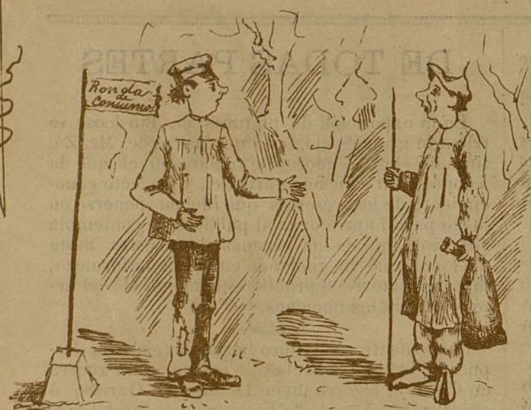
1-O paga los derechos del vino ó se lo decomiso.