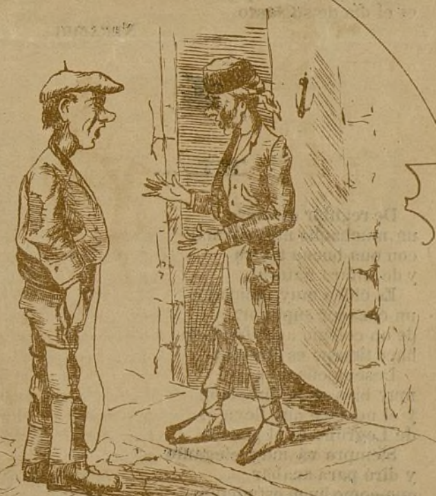
-Me han dicho que bajas mañana à Logroño. -Si señor voy à comprar hierro para las herraduras del veterinario. -Pus mucho listo ties que andar y con cuidiao, no te roben el seron como me robaron ami la cabezada en la posá.