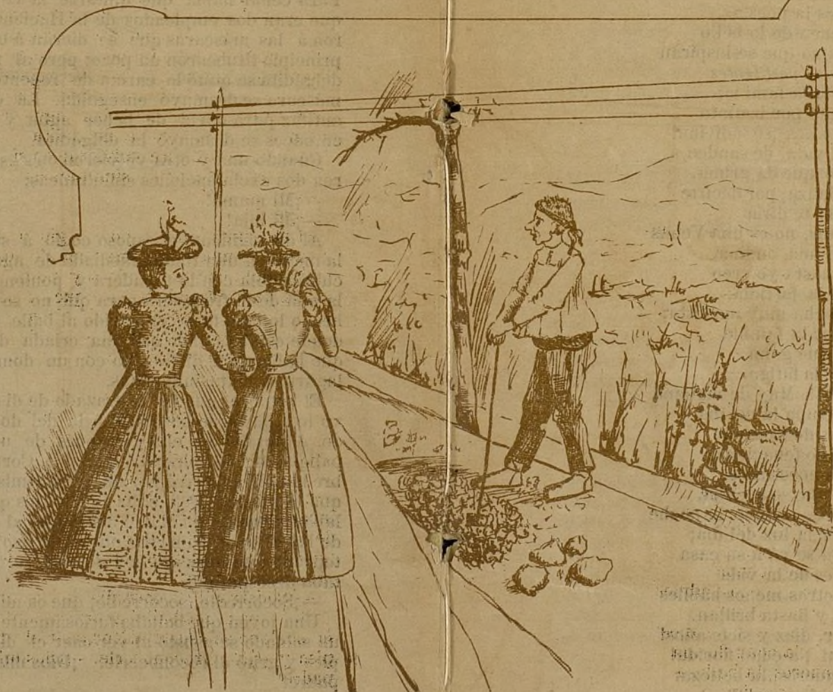
-Señorita no se tape la cara, que si la dejo tuerta ya me casaré con V. -Si, pues peor es el remedio que la enfermedad.