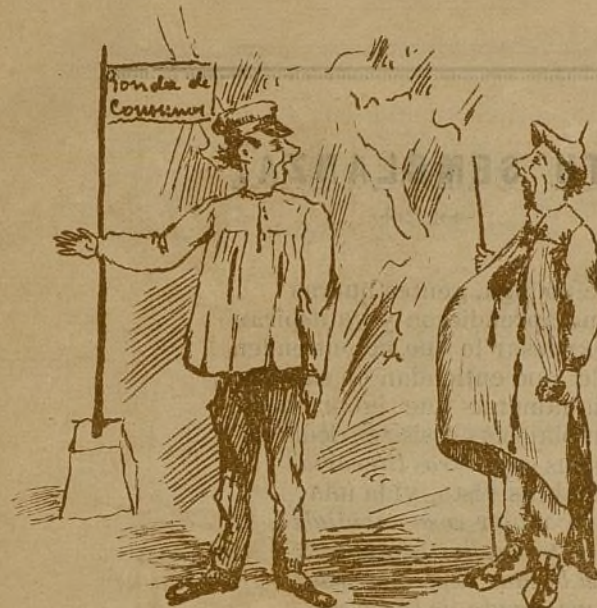
3-Y ahora? Ya no paga consumos, puede V. pasar.