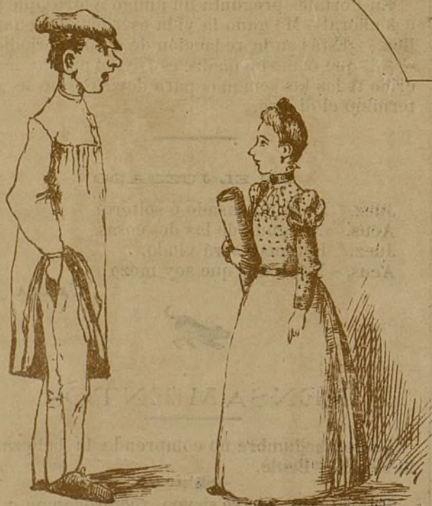
-Ya sé que estubiste en el baile del Teatro. -Mentira. -No lo niegues que bien te pusiste de bailar en un palco con un señorito, y que suspiros dabas! es que te ahogaba el calor que da la careta.