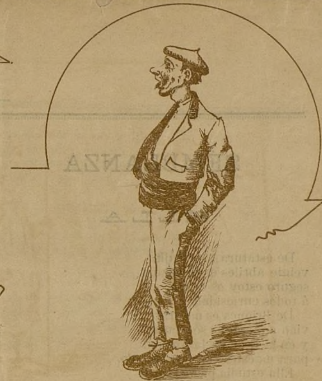
-Uno de la sierra de Canuros con cuatro pares de mulas y una porción de fanegas de tierra, que se gasta los dineros en Logroño viendo los fuegos artificiales y durmiendo en un banco del espolon el día de S. Bernabé, y al siguiente después de las vacas se marcha à su pueblo cantando bajito.