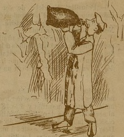
2- Pus .....