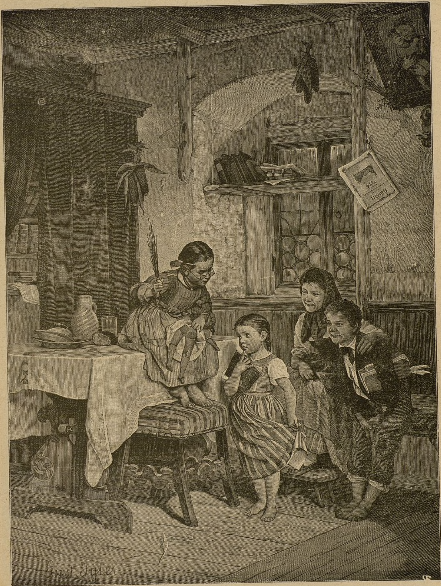
En ausencia del maestro.—(Cuadro de Gustavo Igler).