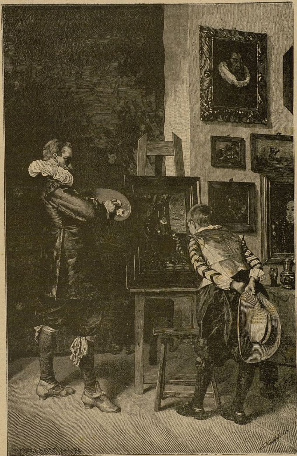
NOTA ARTÍSTICA.—Comtemplando el retrato.