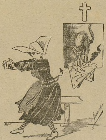
HISTORIA MUDA, por Navarrete.