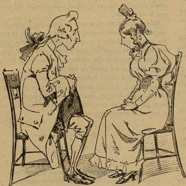
3.—Fines del siglo XVIII.