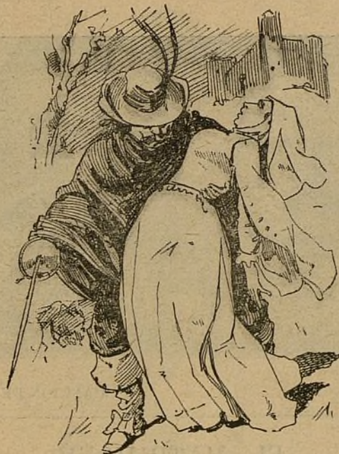
2.—En el siglo XVII.