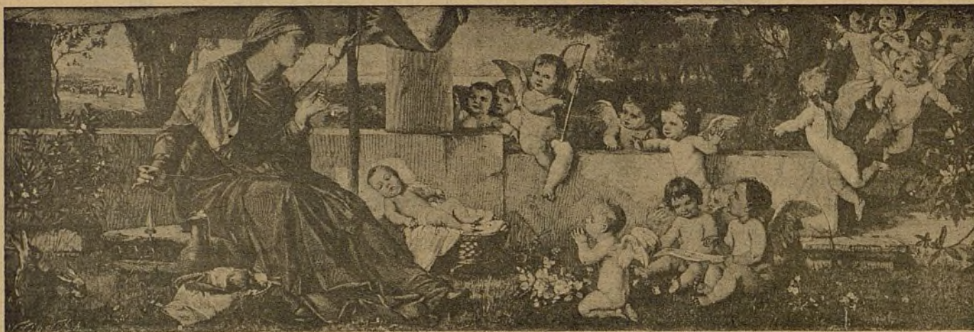
CANCION DE CUNA (cuadro de A. Lanenstein).