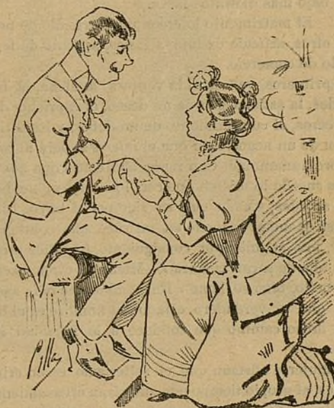
4.—Principios del siglo XX.