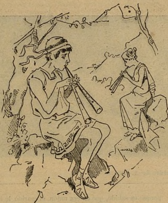
1.—En los dulces tiempos de la antigua Grecia.