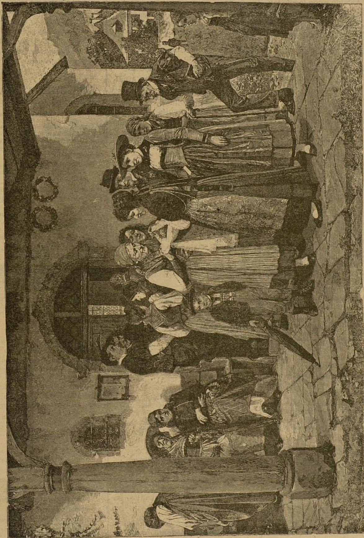
PREPARATIVOS DEL BAUTIZO