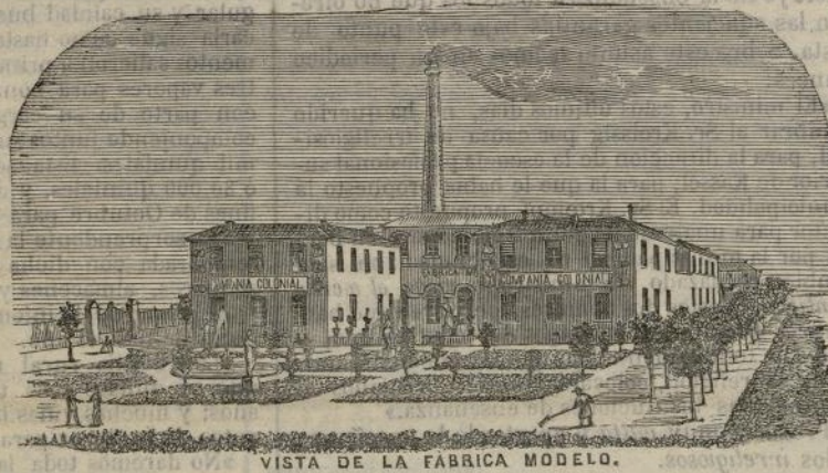
VISTA DE LA FABRICA MODELO.