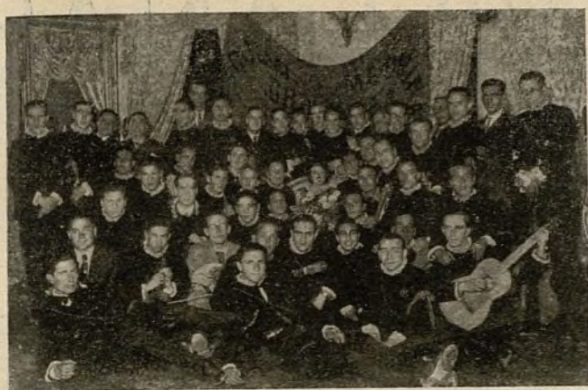
La Estudiantina de la Facultad de Granada, acompañada de «Miss Cartagena» durante una visita que hicieron a esta última ciudad.