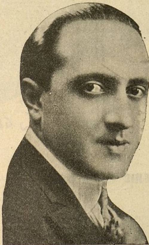
G. H. MATOS RODRIGUEZ Celebrado compositor uruguayo