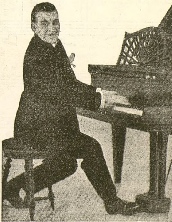
E. DELFINO (DELFI)

El humorista del piano y uno de los más destacados compositores argentinos.