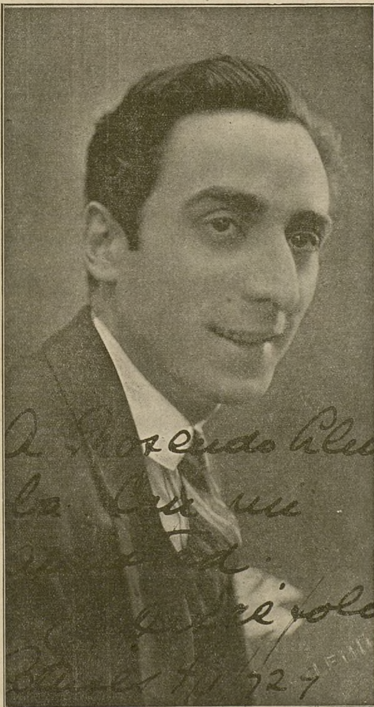
ENRIQUE SANTOS DISCEPOLO