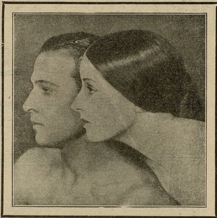
Última fotografía del mal grado artista.

Aquel mozo arrogante de la dulce mirada, que en el film amoroso sus empujes mostró, Caballero moderno de una extraña cruzada Por quien muchas pebetas se sintiero prendadas, ¡ Se murió !