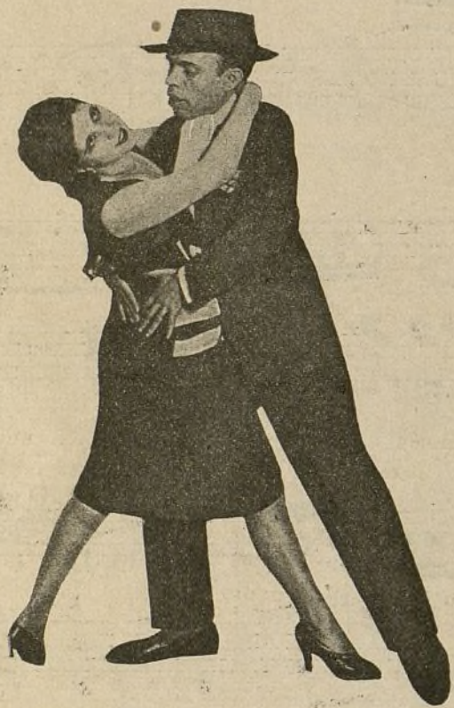
He aquí un momento de lo que pudiéramos llamar «la prehistoria del tango» del «tango arrabalero» de los suburbios de Buenos Aires.

Es en un barrio apartado, sórdido, maloliente, de Buenos Aires, hace muchos años.