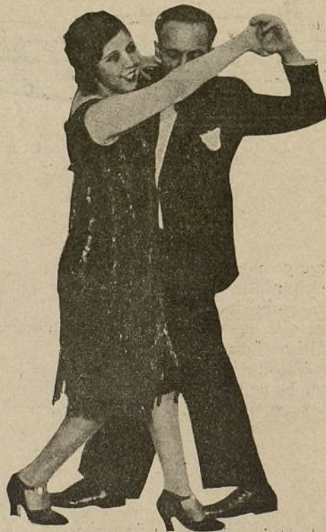
El tango ha llegado a París. El baile bonarense se ha vestido de etiqueta, y constituye el encanto de las damas de la alta sociedad.

Es una sensación que se transmite rápidamente de corazón en corazón, un tintineo interior que subyuga a los espectadores con su ritmo desconocido, como una sua-