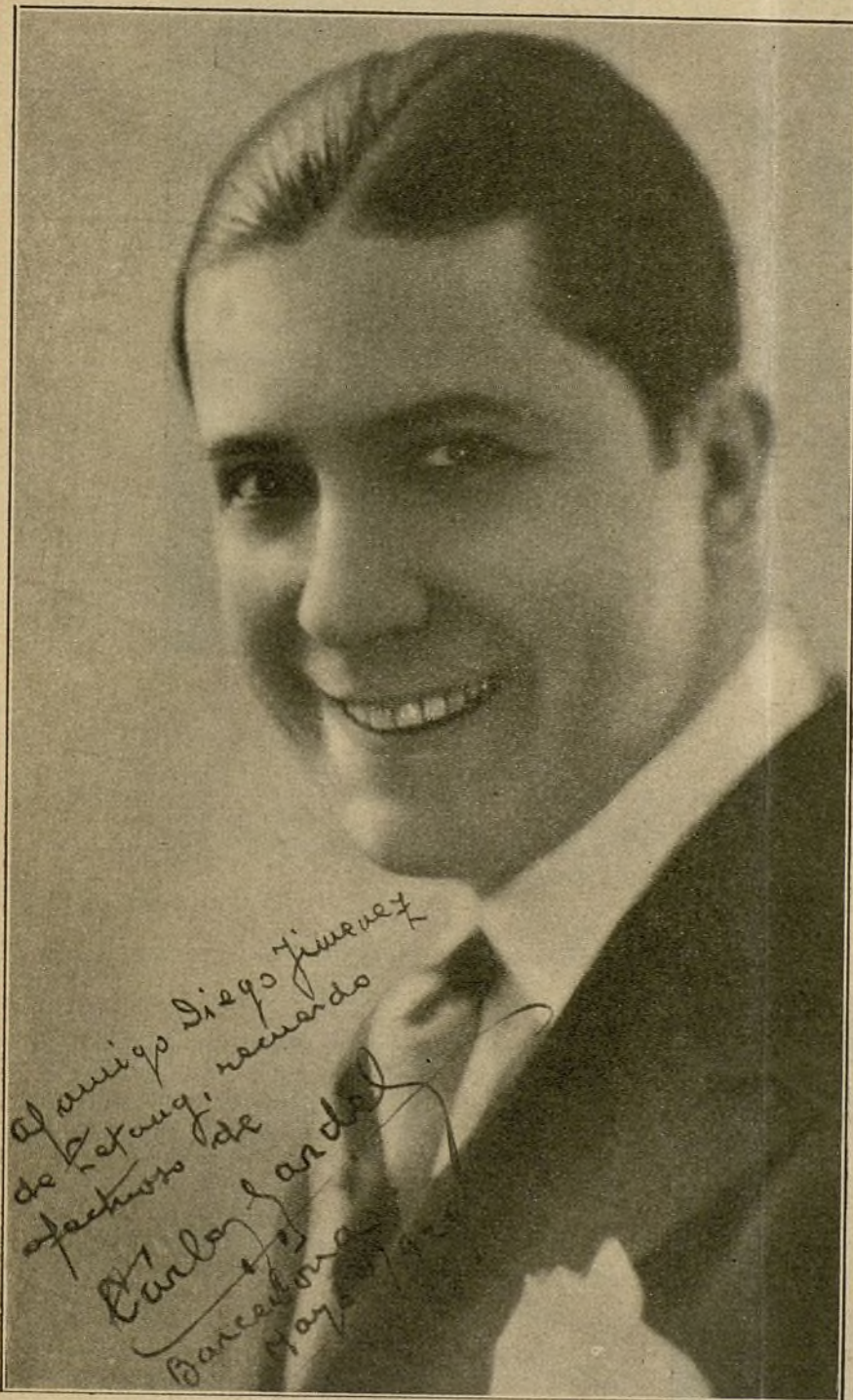
El atractivo de la sonrisa de Gardel, cuando se intercala en los descansos, baña a las «pebetas» ávidas que le están escuchando en una cálida e indescriptible sensación