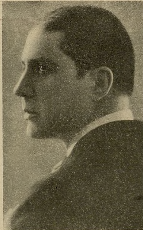
El otro Gardel

Luego salimos a las Ramblas. Nadie le reconoce, y la sonrisa de Gardel se acentúa al gustar con la brisa de la madrugada de mayo, el encanto, privilegio de las almas selectas, de