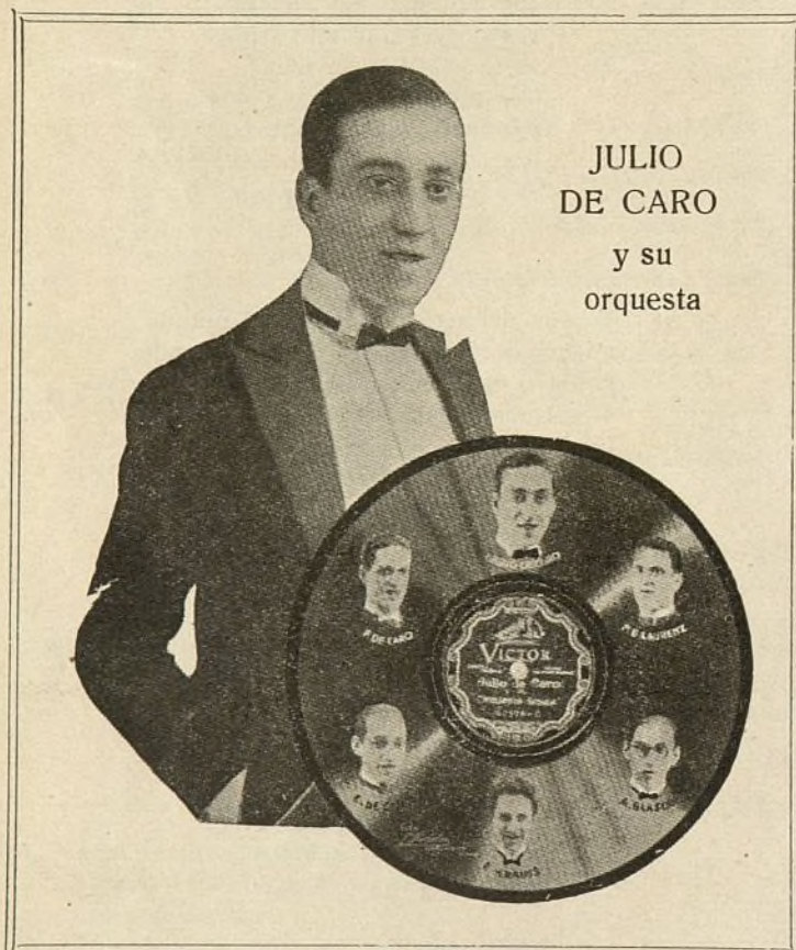
JULIO DE CARO y su orquesta

El tango argentino le debe mucho a Julio De Caro... Julio De Caro pone en sus composiciones una personalidad inconfundible. El arte verdadero, secundado por una sensibilidad poco común, han hecho de los tangos de este muchacho una expresión musical nueva y distinta. Ha borrado el rezongo procax del arrabal; ha disipado la guaranguería de los cortes y el atrevimiento lujurioso de las quebradas... ¿Tangos de salón? ¿Musiquita de «boudoir»? ¡No! ¡Alma criolla, corazón porteño, traducido en notas que se enhebran en un ritmo de elegancia sin peder la honda emoción que siempre tuvo la música popular. Estilizado así el tango, se ha purificado y Julio De Caro ha