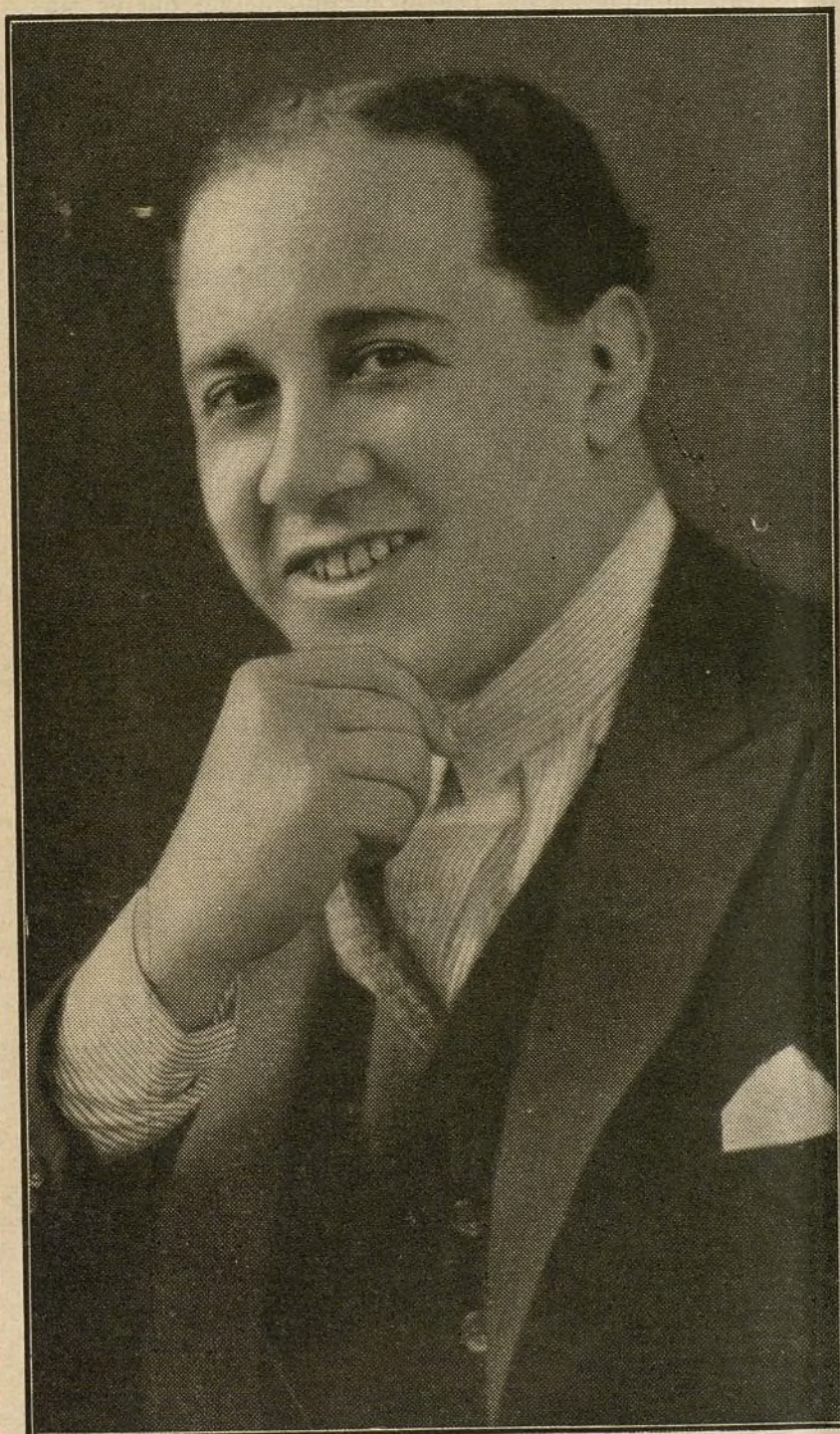
C. ESTEBAN FLORES (CELE)

Popular poeta argentino y excelente letrista, autor de innumerables tangos, entre ellos Ufa... ¡Qué secante! , uno de los éxitos actuales de la orquesta típica Buzón.