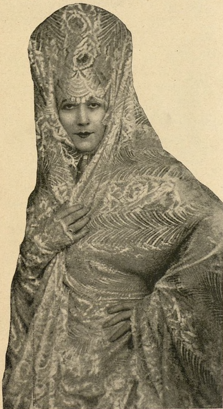
OFELIA DE ARAGON

Bellísima artista española creadora del pasodoble «Una reja en Triana»