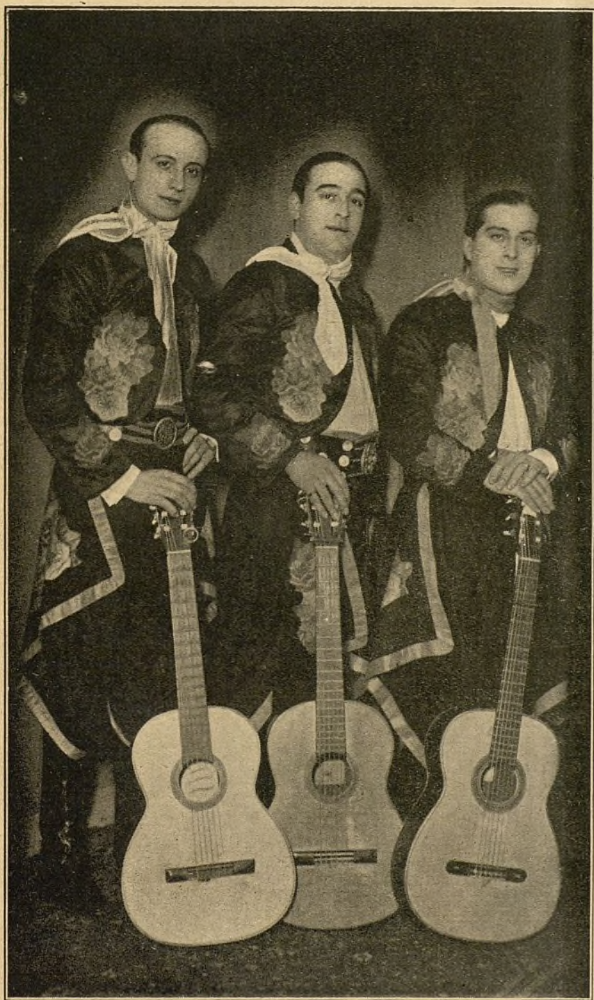
SCALÓN - SPAVENTA Acompañados por el guitarrista Morales