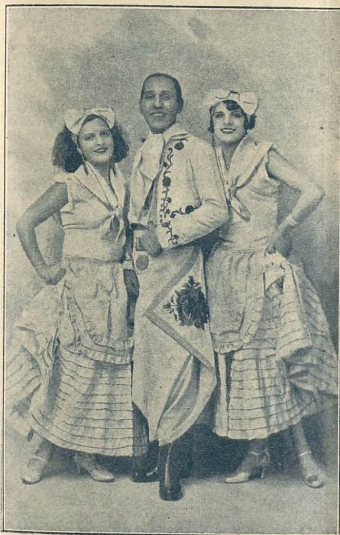
EL TRIO ARGENTINO DELVO

Notabilísimos y populares artistas de cantos y bailes americanos e internacionales, cuya jira por España constituye un gran éxito.