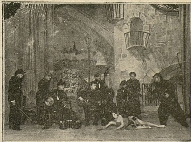
«Delvo and Delva and Co.» en su original número apache