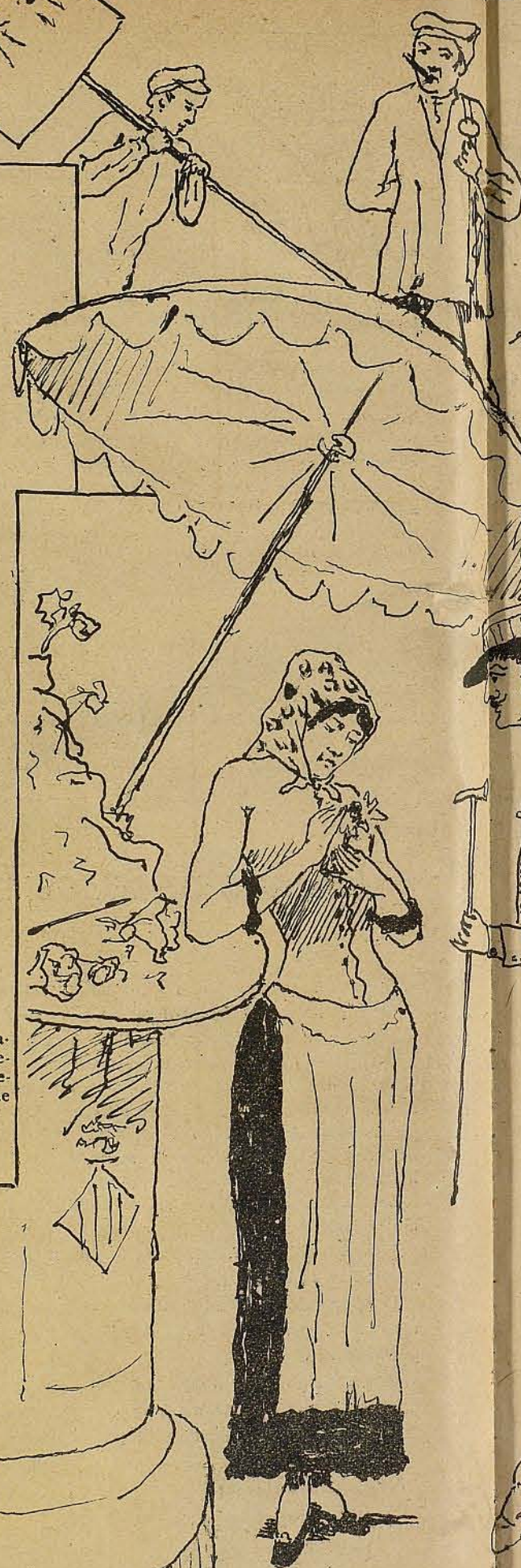
RAMBLA DE LAS FLORES

En la taquilla del teatro de idem —Esta pieza es mala. —¿Cree V. que voy á dar una pieza buena por ver una mala?