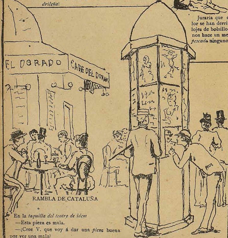
RAMBLA DE CATALUÑA

Juraría que con este ca- lor se han derritido los re- lojes de bolsillo!... Lo me- nos hace un mes que no he pescado ninguno.