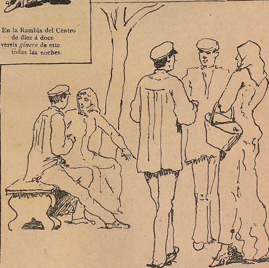
RAMBLA DE SANTA MÓNICA