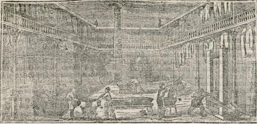
(Vista interior del obrador y laboratorio.)