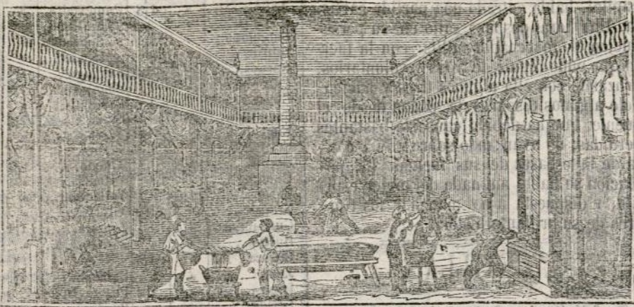
(Vista interior del obrador y laboratorio.)